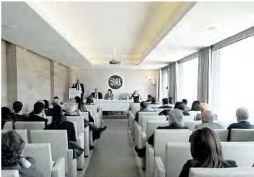
BASTIA UMBRA La platea all'incontro organizzato dalla S&R